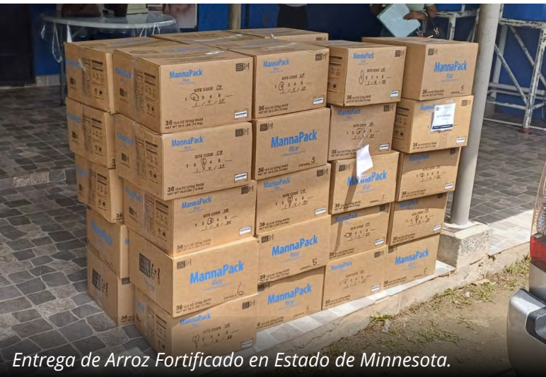
Entrega de Arroz Fortificado en Estado de Minnesota.

una alimentación balanceada que apoye el crecimiento y desarrollo adecuado de los estudiantes, mejorando así su rendimiento académico y su salud en general.