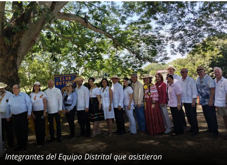
Integrantes del Equipo Distrital que asistieron