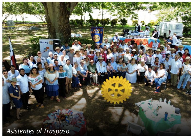
Asistentes al Traspaso