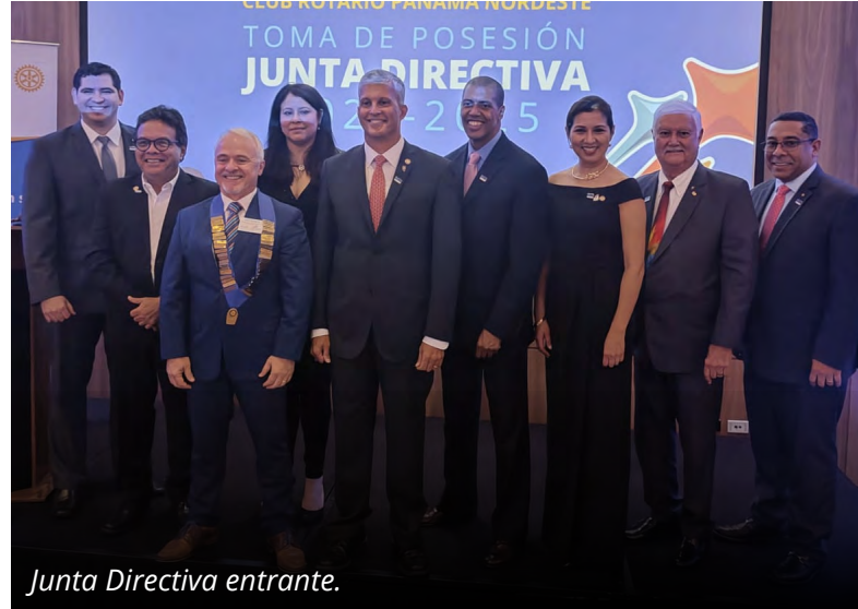
Junta Directiva entrante.