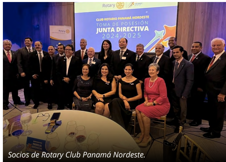
Socios de Rotary Club Panamá Nordeste.